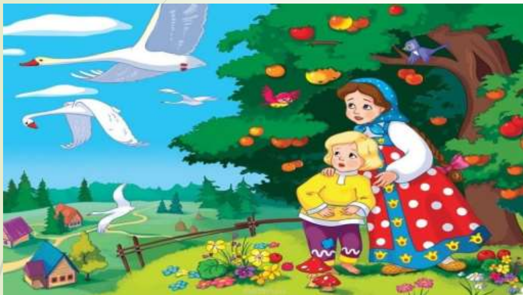
Русская народная сказка «Гуси-лебеди»