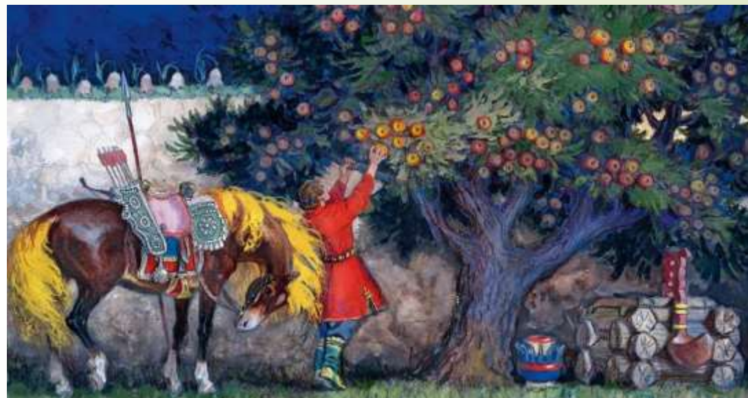
Русская народная сказка «Молодильные яблоки»